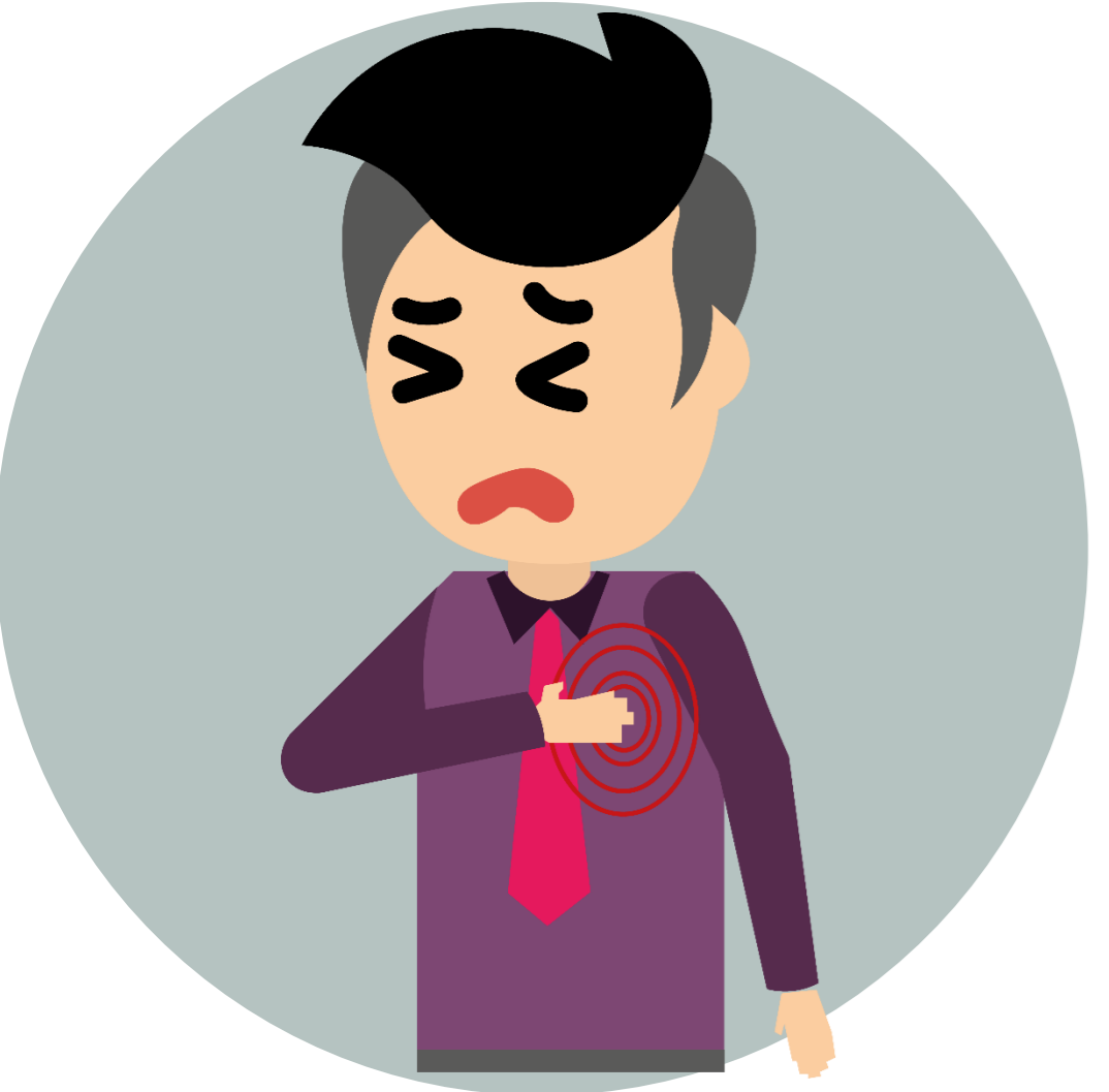
Palpitaciones al corazón