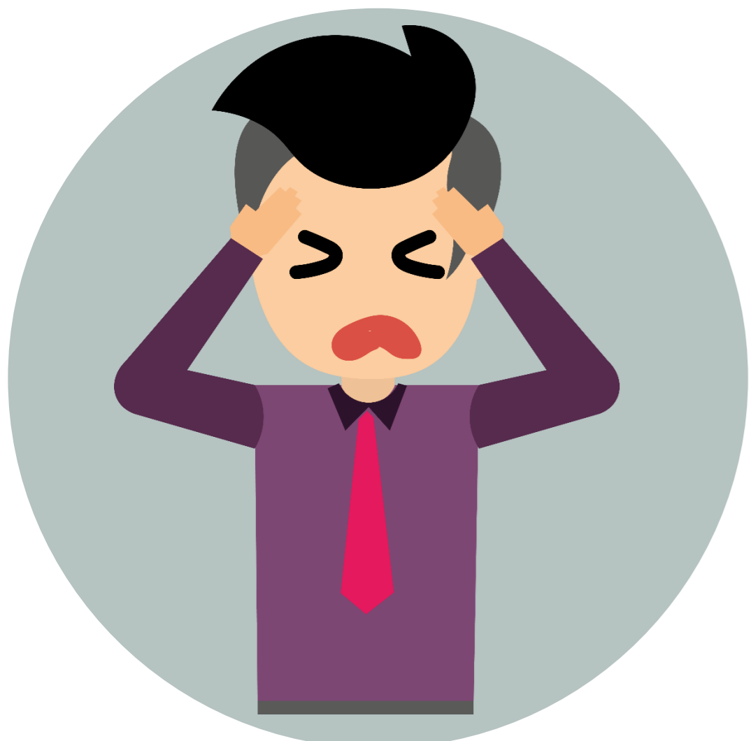
Dolor de cabeza