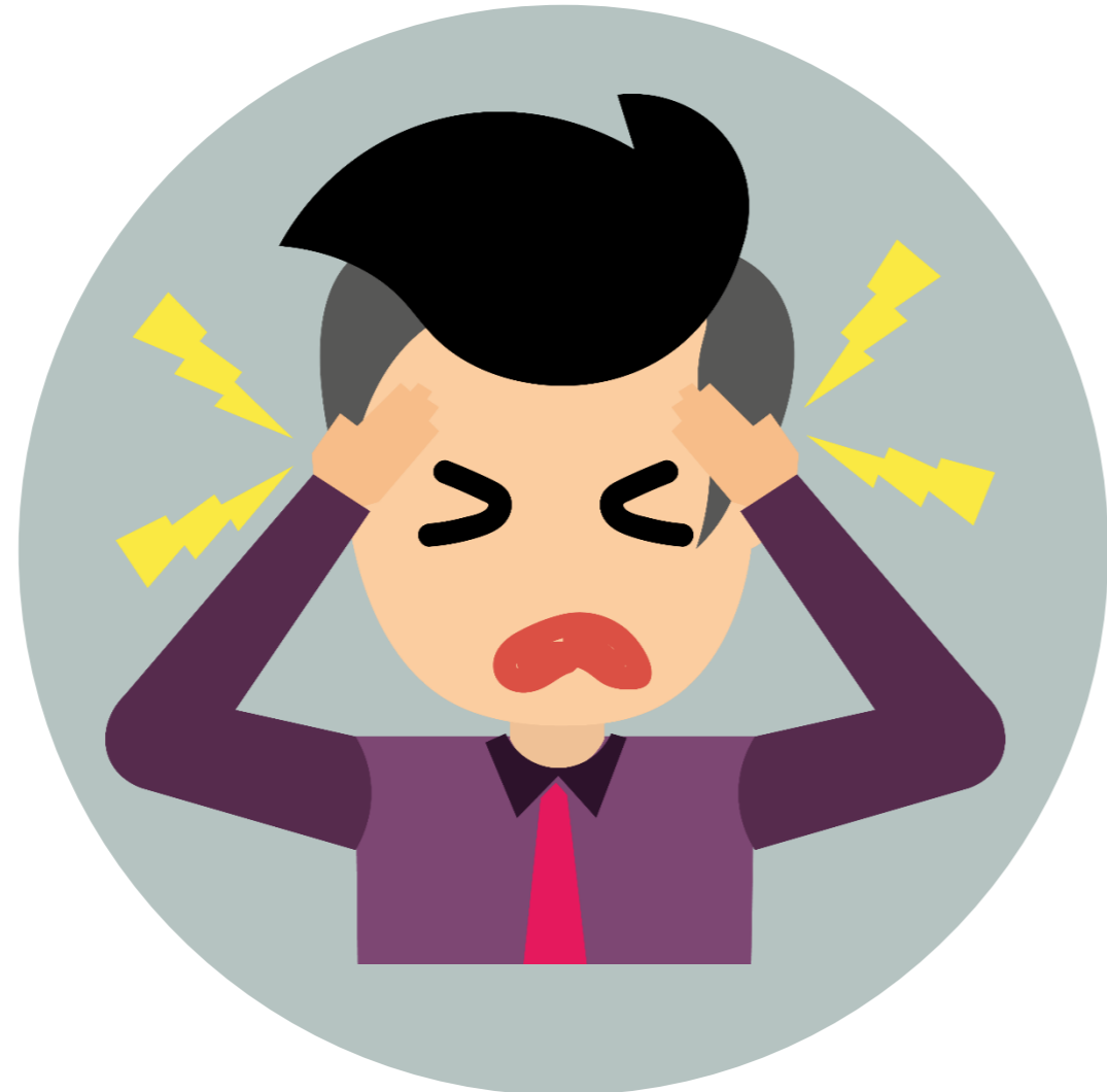
Zumbidos de oídos