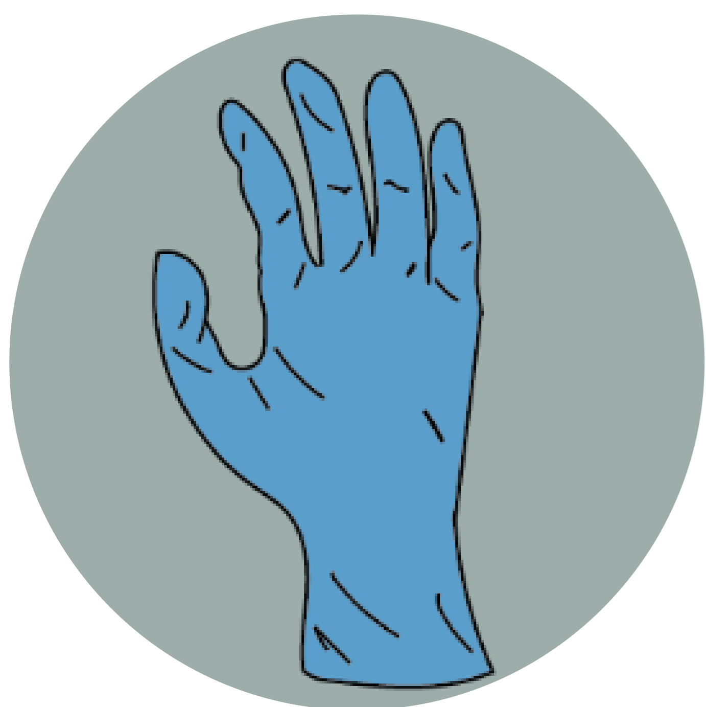
Guantes de látex, nitrilo, etc.