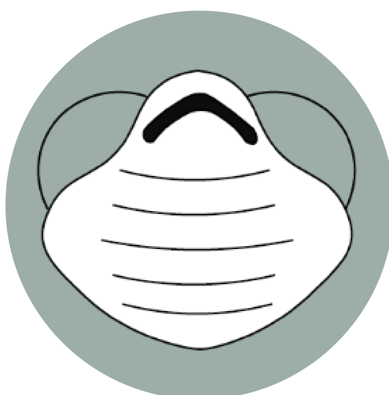
Cubre boca de preferencia N-95 o quirúrgico