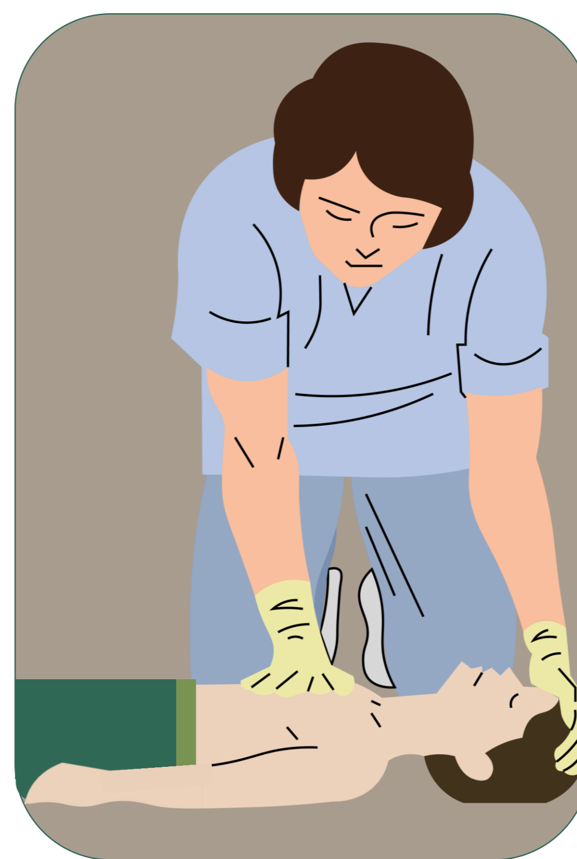
Con la palma