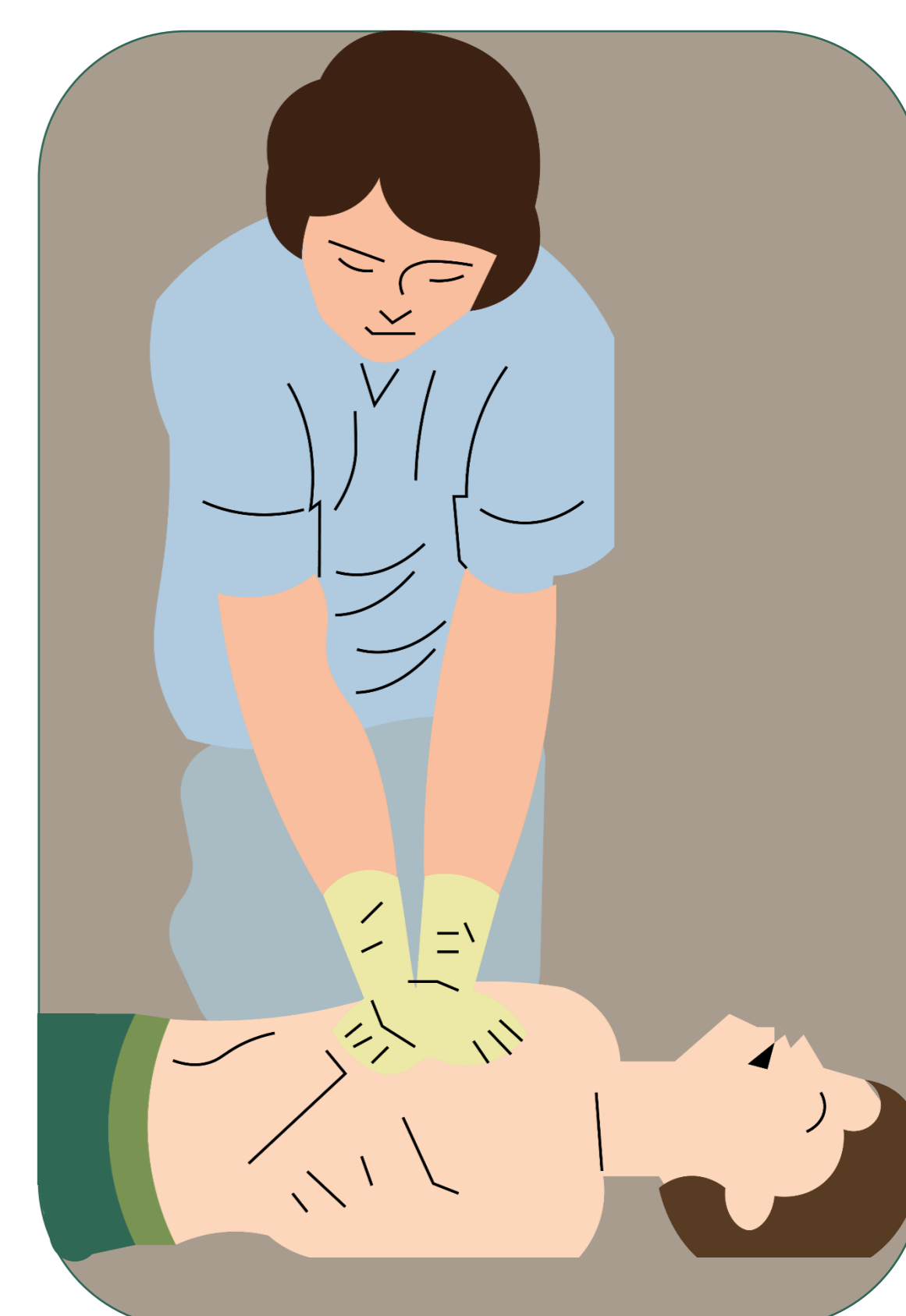
Con ambas palmas